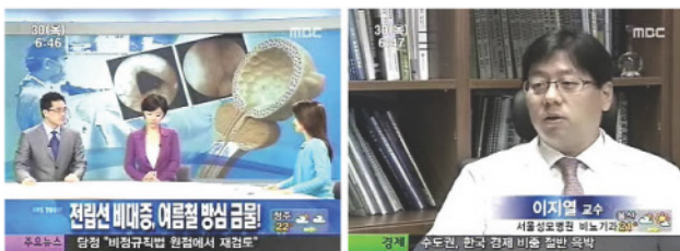
(MBC뉴스투데이 2009. 7. 30)

여름철 방심하기 쉬운 전립선질환, 전립선비대증은 겨울철에는 갑작스럽게 떨어진 기온이 전립선의 요도괄약근을 자극해 배뇨장애를 악화시킵니다. 따라서 온도가 높아지는 여름철에는 증상을 잘 못 느끼게 됩니다. 하지만 에어컨과 같은 냉방장치로 인해 온도가 낮은 실내에서 장시간 생활할 경우 체온이 낮아지서 전립선 질환이 악화될 수 있습니다.